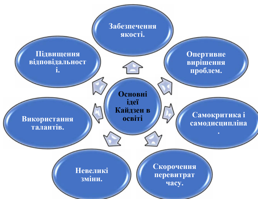
Рис. 3. Основні ідеї Кайдзен в освіті

Для делегування повноважень у концепції Кайдзен пропонуємо використовувати у закладі освіти, враховуючи такі компоненти (рис. 3):