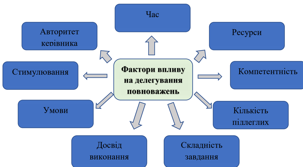
Рис 1. Фактори впливу на делегування повноважень

На основі аналізу джерел можна визначити низку факторів, які мають вплив на делегування повноважень: час, авторитет керівника, ресурси, компетентність, умови, кількість підлеглих, складність завдання, досвід виконання (рис. 1):